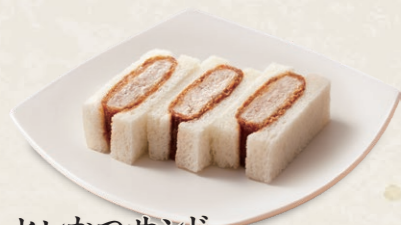
ヒレかつサンド [3切] 450円(税込495円) [6切] 885円(税込973円)