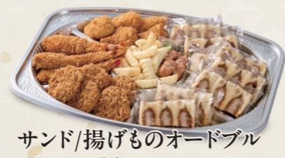
サンド/揚げものオードブル 一口ヒレかつ・海老フライ・クリームコロッケ ウインナー・ハーフサンド・フレンチポテト 6,200円(税込6,820円)~