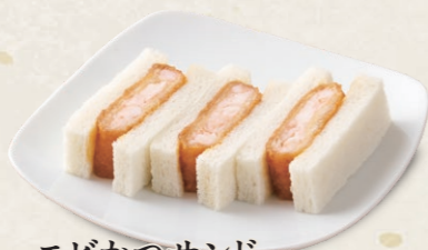
エビかつサンド [3切] 490円(税込539円)