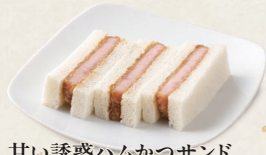
甘い誘惑ハムかつサンド [3切] 460円(税込506円)