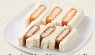
ミックスサンド(ヒレ・エビ) [各3切] 925円(税込1,017円)