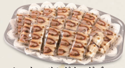
ヒレかつサンドオードブル A(ハーフカット18パック) 4,400円(税込4,840円) B(ハーフカット22パック) 5,400円(税込5,940円) C(ハーフカット26パック) 6,300円(税込6,930円)