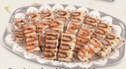
ミックスサンドオードブル A(ハーフカットヒレ10パック・ハーフカットエビ6パック) 4,250円(税込4,675円) B(ハーフカットヒレ12パック・ハーフカットエビ8パック) 5,200円(税込5,720円) C(ハーフカットヒレ14パック・ハーフカットエビ10パック) 6,400円(税込7,040円)