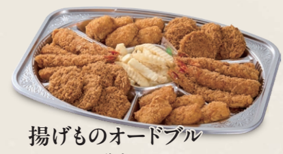
揚げものオードブル 一口ヒレかつ・海老フライ・クリームコロッケ フレンチポテト 5,050円(税込5,555円)~