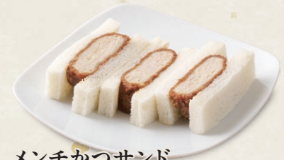
メンチかつサンド [3切] 400円(税込440円)